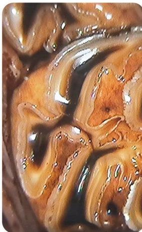
Pferdezahn Ansicht mit dem Dental Scope