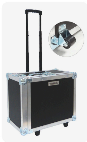
Endoskop Transportkoffer für den mobilen Einsatz